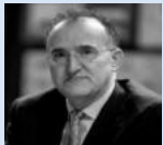
D. Isaac Merino Jara Magistrado del Tribunal Supremo

18:00 OBLIGACIÓN DE INFORMACIÓN SOBRE BIENES O DERECHOS POSEÍDOS EN EL EXTRANJERO: STJUE DE 27 DE ENERO DE 2022, C-788/19